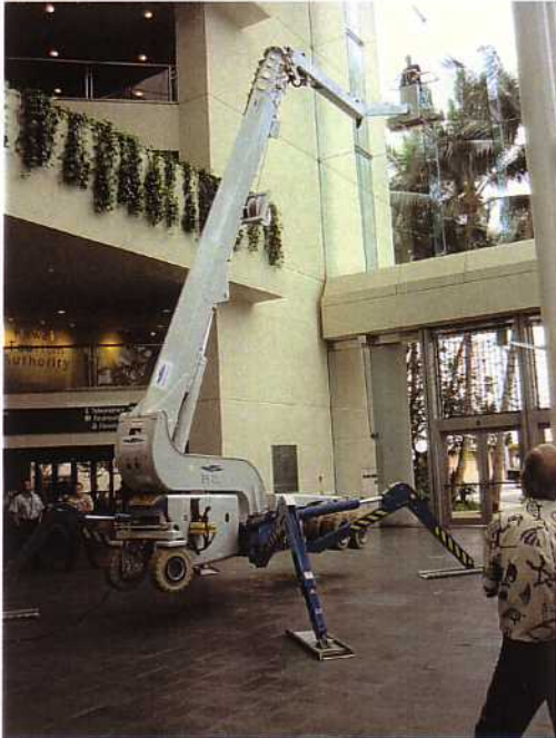
Photo: Eine FALCON SPIDER in Aktion