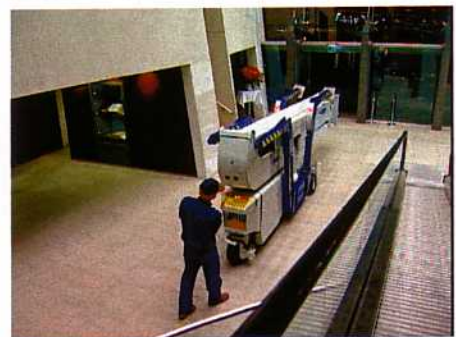
Photo: FALCON SPIDER 290, 29 m Arbeitshöhe. Introduction von dem verbesserten doppelten Schwenkarm-System.

E. FALCK SCHMIDT A/S entwickelt und produziert seit fast 40 Jahren Hubarbeitsbühnen. Das Konzept der SPIDER wurde in den späten 70'er Jahren von der Firma E. FALCK SCHMIDT A/S eingeführt und wird seit dieser Zeit weltweit geliefert.